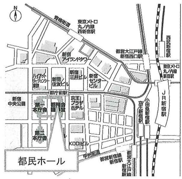
東京都庁 都民ホール (都議会議事堂1階) 新宿駅西口から徒歩10分または都庁前駅